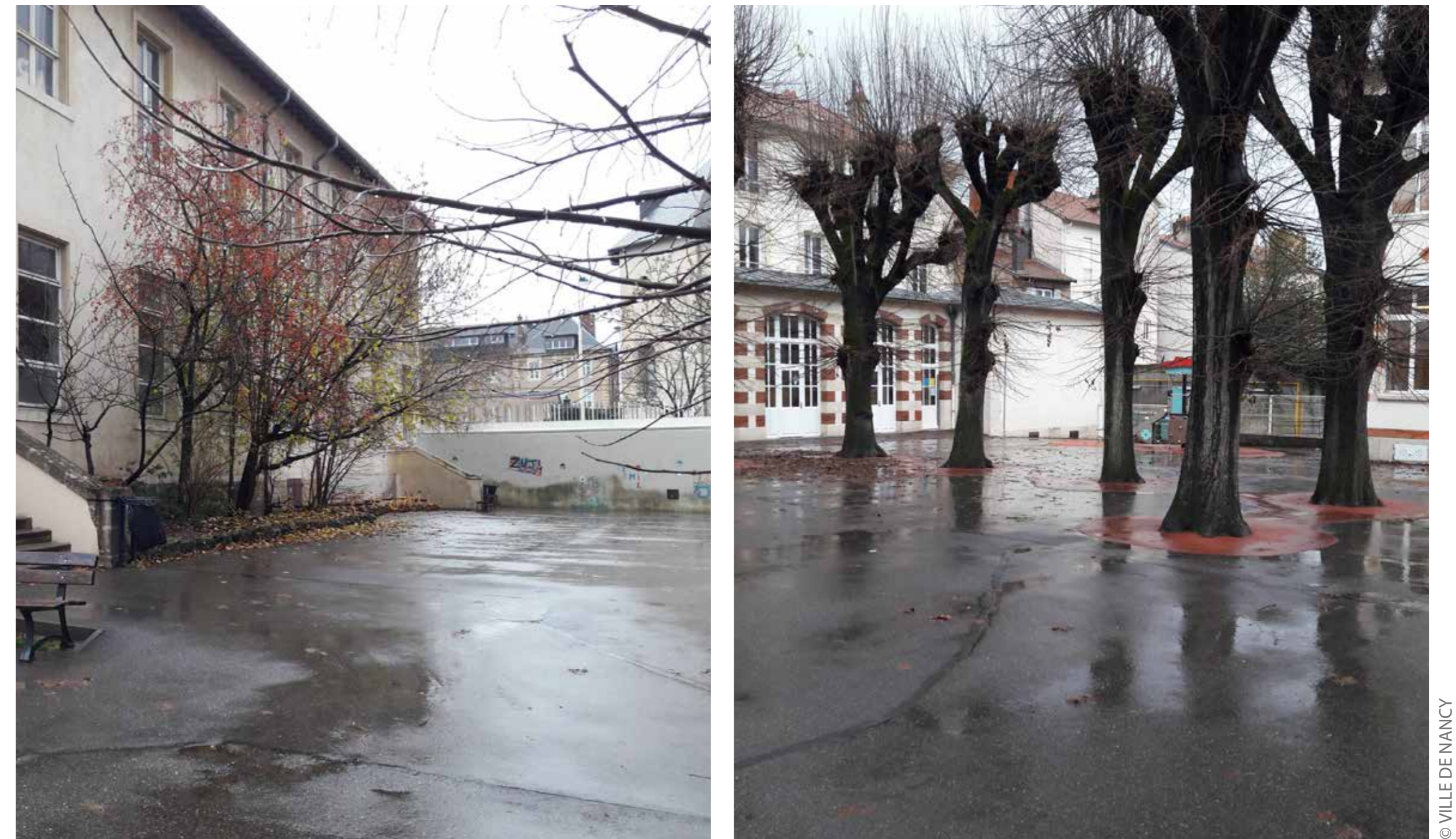
Photos de l'état avant-projet de la cour de l'école