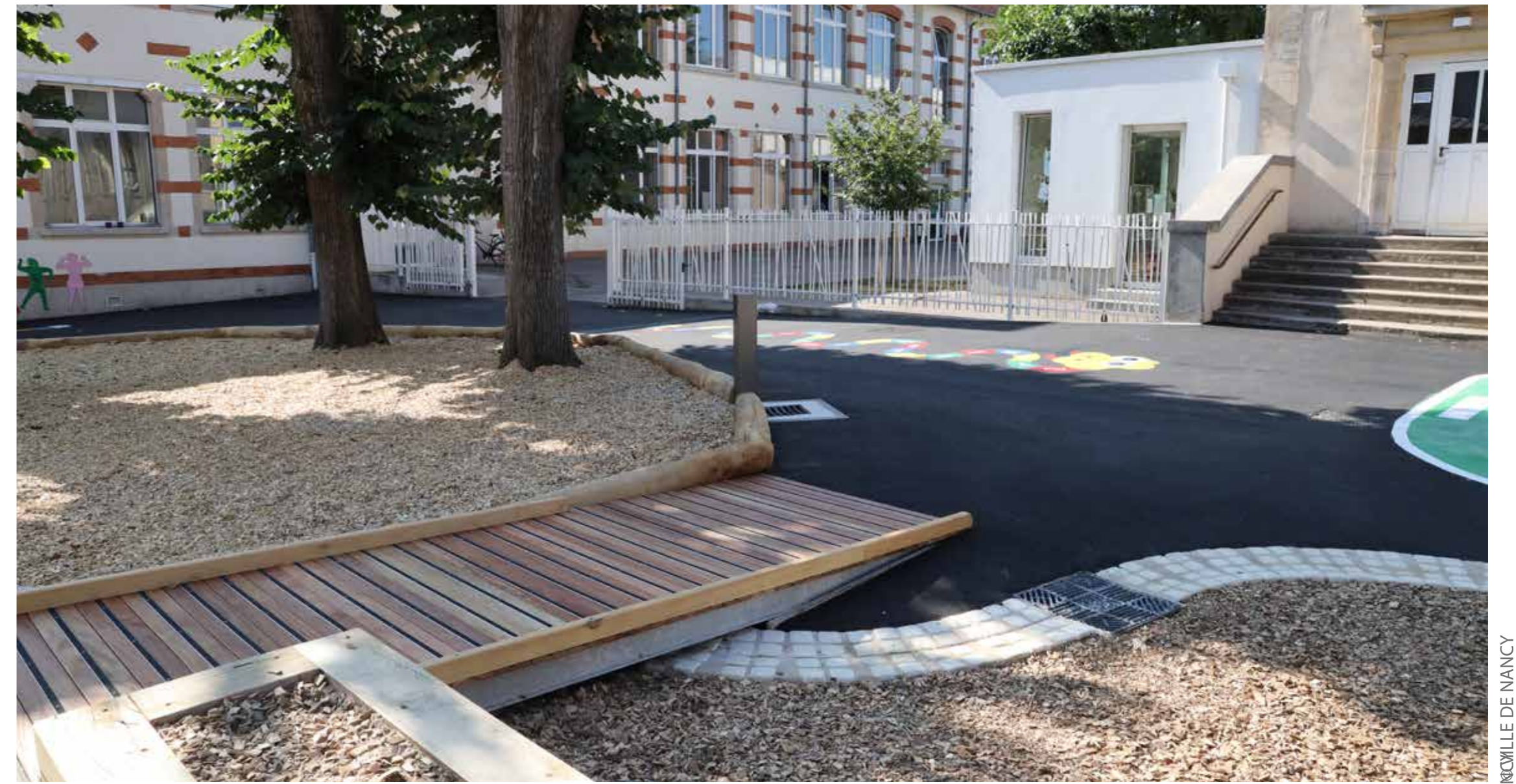
Clairière des petits lutins en copeaux et serpent