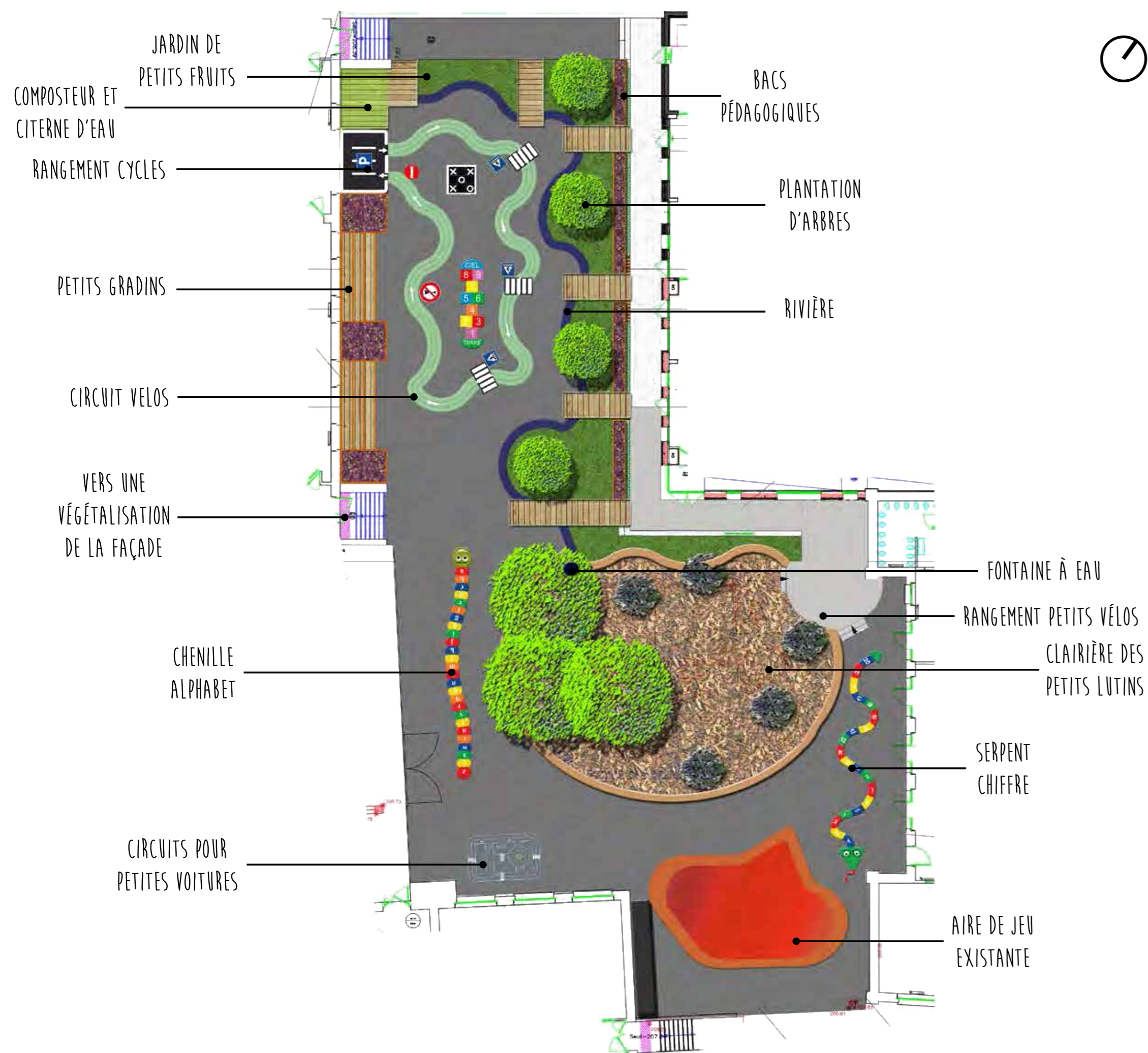
Plan d'aménagement de la cour d'école Emile Gallé : diversification des usages

La cour de l'école Émile Gallé vient s'inscrire dans ces jardins d'école. Elle est conçue comme le prolongement de la salle de classe et sert aux activités pédagogiques et à l'éveil, autant qu'aux jeux. Différents aménagements ludiques ont été mis en place comme un circuit vélos , une clairière avec un sol de copeaux de bois , un jardin pédagogique etc. Les élèves ont bien accueilli leur cour. Il a fallu un temps d'accompagnement par l'équipe enseignante pour certaines activités (sens de circulation pour les vélos, explication copeaux de jeux vs copeaux de jardinage, etc.). Un gros travail pour l'équipe enseignante suit le projet : tout un règlement de la cour est à réécrire et une sensibilisation à faire pour les élèves comme pour les enseignants. Le travail d'appropriation par les enfants est inévitable pour son bon fonctionnement et sa réussite. L'étape « retour d'usage » est importante car elle donne des pistes d'améliorations pour des éventuels changements ou pour les projets à venir, comme par exemple inscrire l'opération de réhabilitation de la cour dans le projet d'école ou encore prévoir un accompagnement des équipes pédagogiques pour faire vivre le projet, au delà de la concertation.