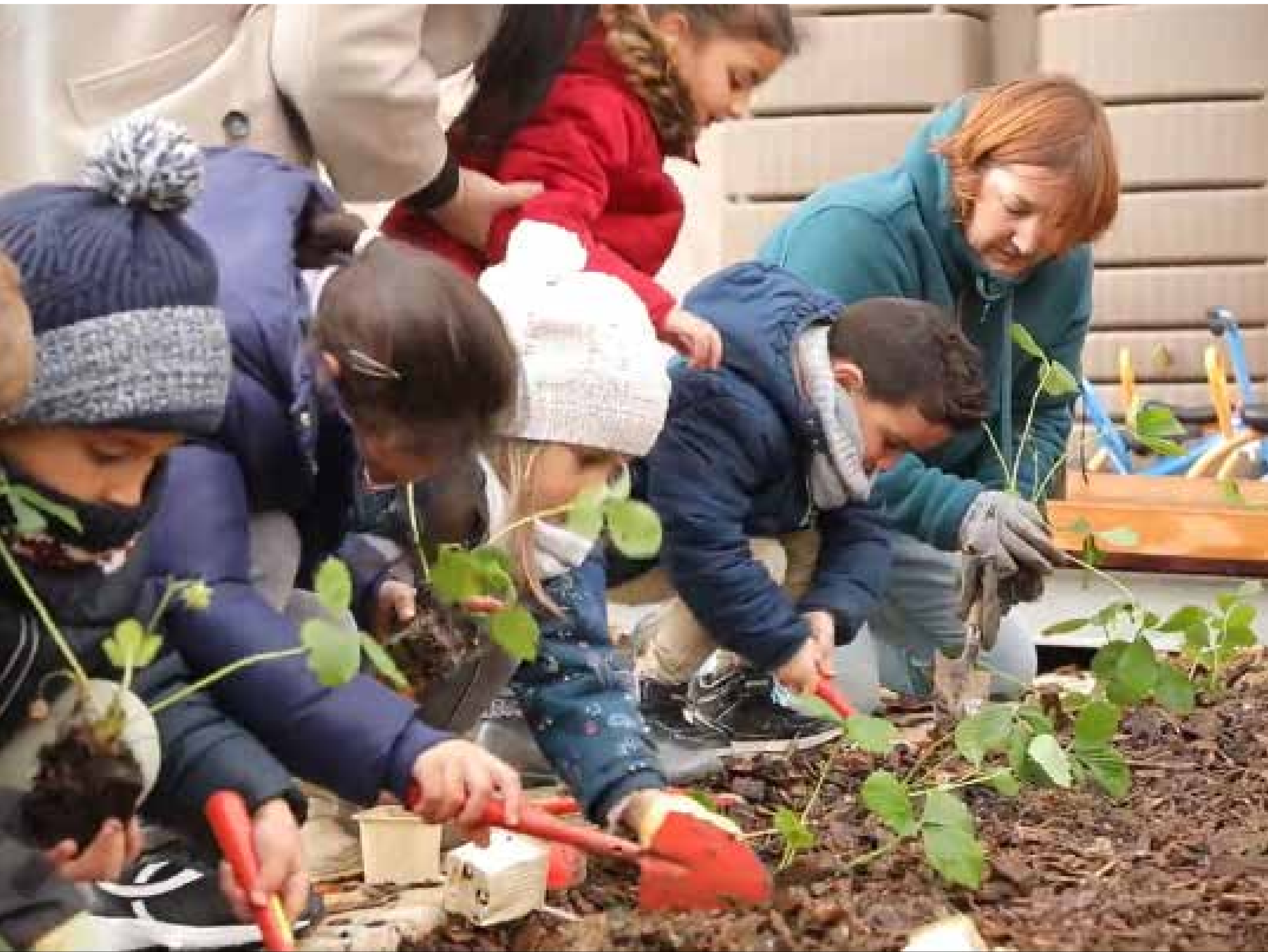
La cour d'école Emile Gallé, Nancy Ville de Nancy