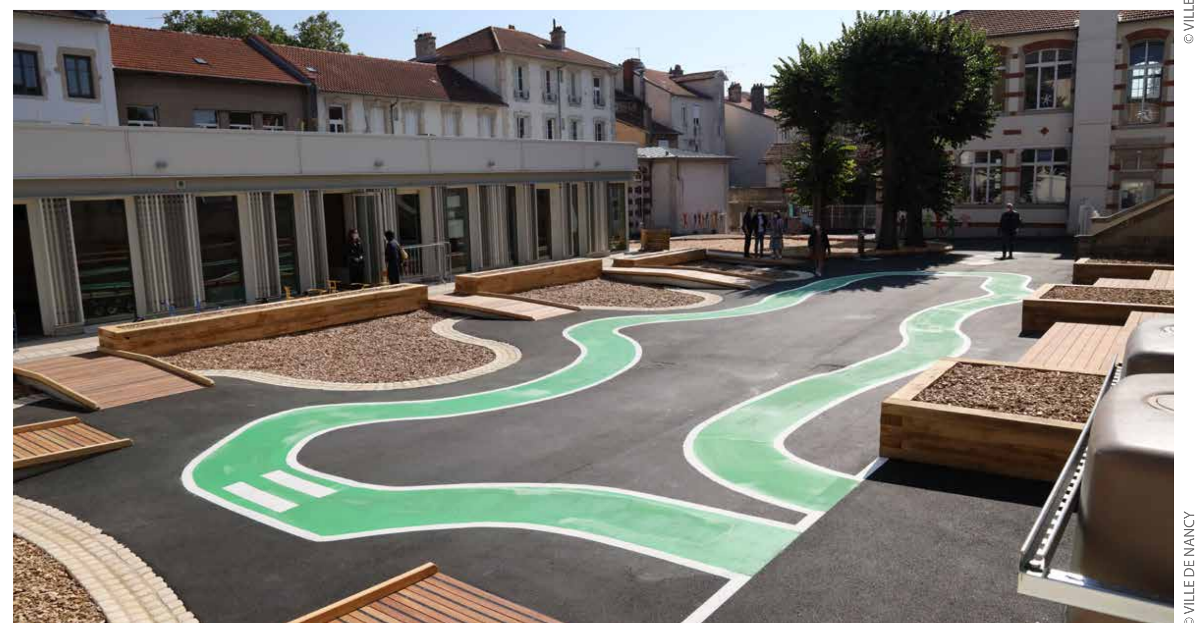
Circuit vélo et espaces en copeaux