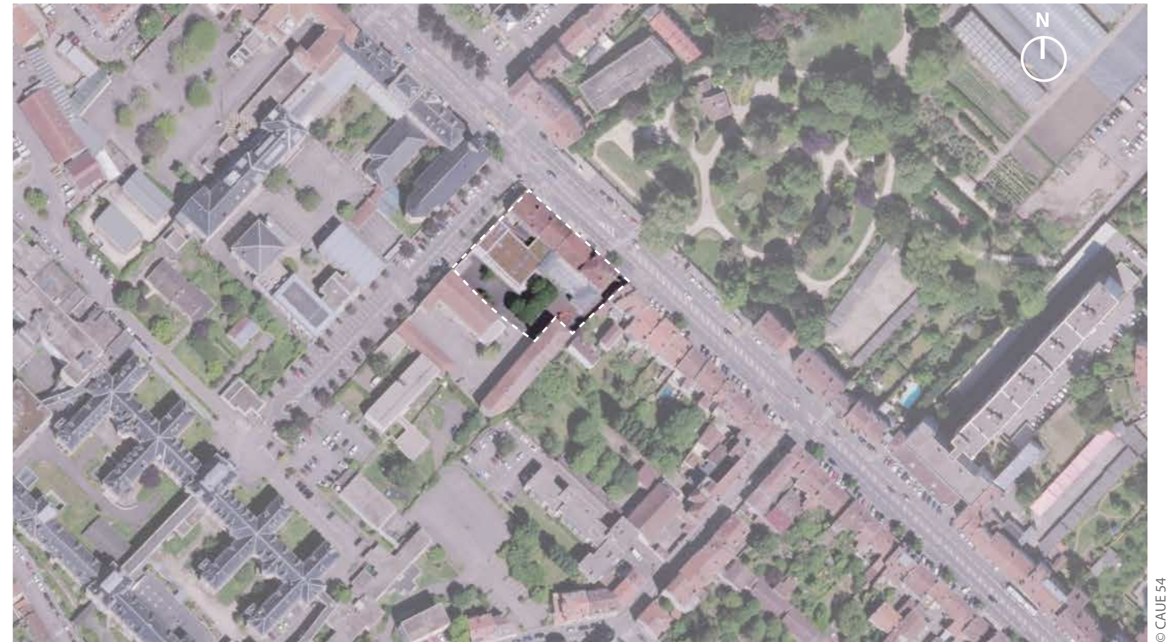
Plan de situation du projet